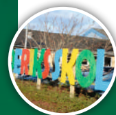
Ledelse og skolebestyrelse på Frederiks Skole.

At AIF nu vil lave Padelbaner ved hallen, er derfor ikke kun en gave til AIF's medlemmer, men også for skolen, da det netop vil give endnu flere muligheder for vores elever i at inddrage i sunde fællesskaber, samt være en del af en fortælling om et foreningsliv i Frederiks, der følger tiden, og udvikler sig med den. Vi glæder os meget til banerne står færdig."